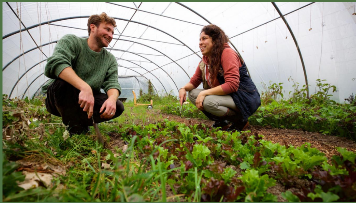
Ferme des Noires Terres