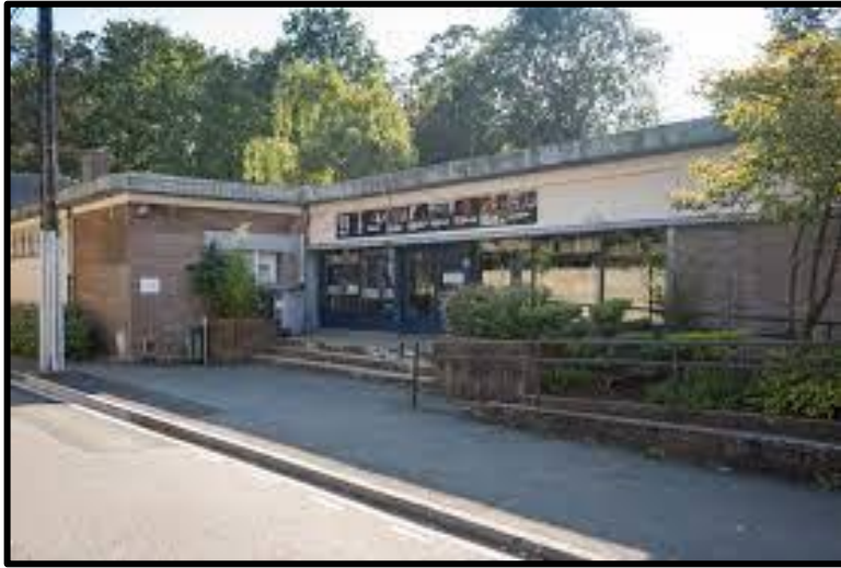
Zeppelin St André Lez Lille