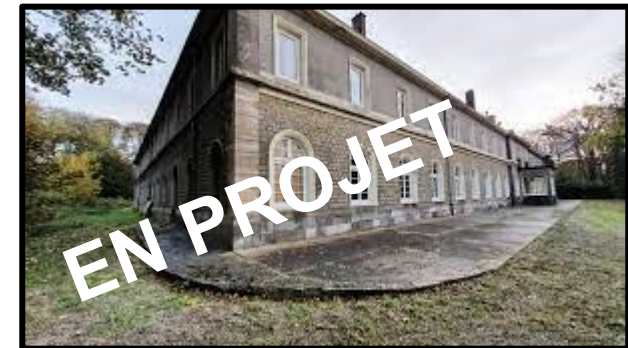
Village éco-solaire de la Visitation St Martin Boulogne