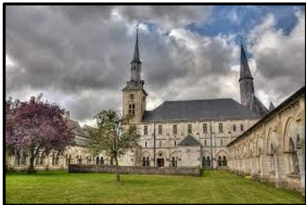
Chartreuse de Neuville Montreuil