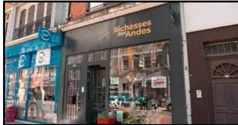
Richesse des Andes Lille